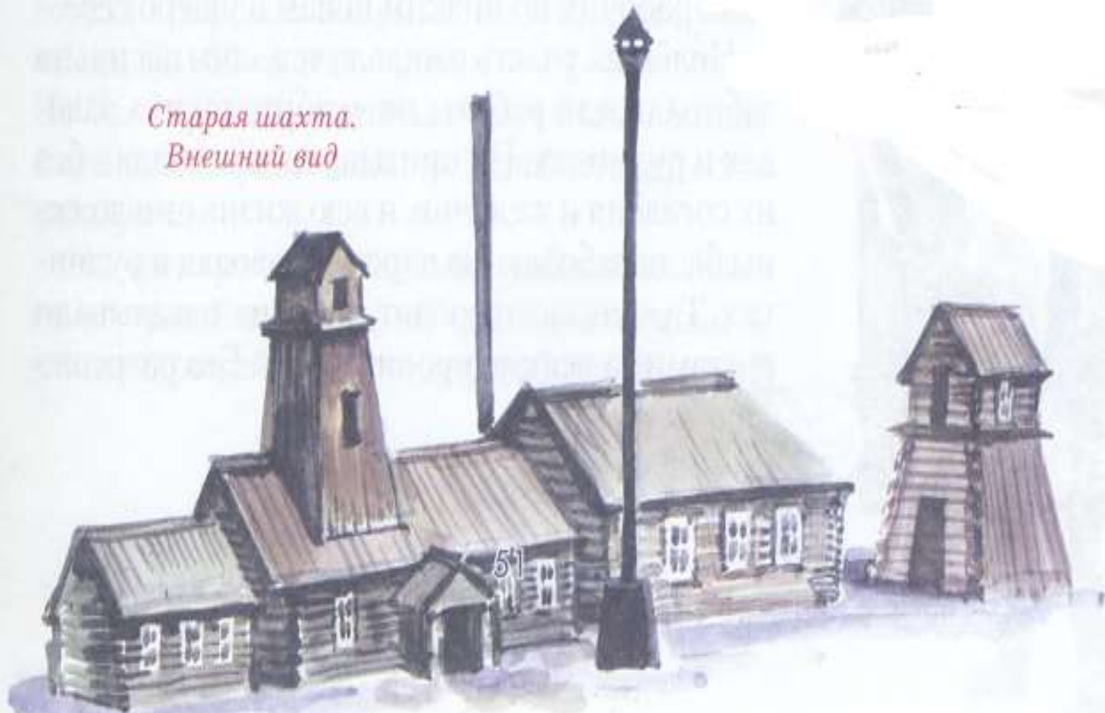
Старая шахта. Внешний вид