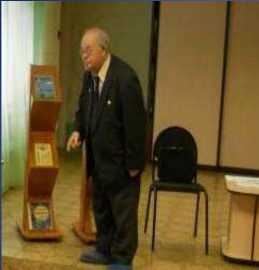
Эдуард Гольцман – Кузбасский детский поэт