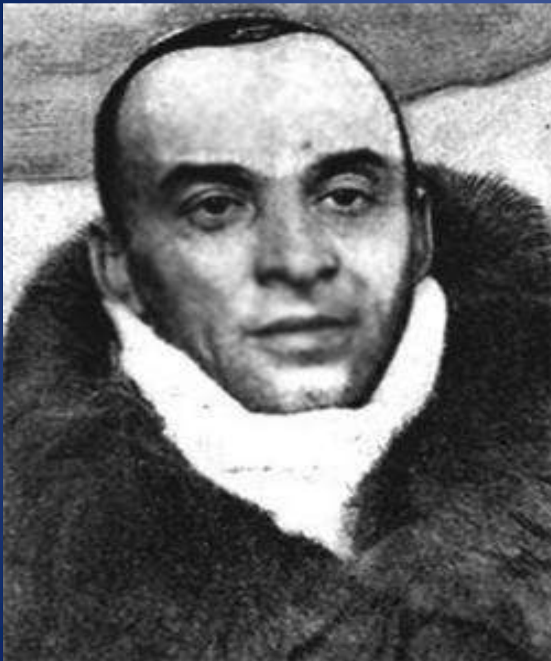
Ольхон Анатолий Сергеевич (наст. фам. Пестюхин) (11 марта 1903, г. Вологда – 13 ноября 1950, г. Москва), поэт, фольклорист, переводчик, корреспондент