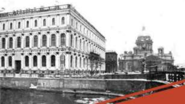
ЗДАНИЕ ВСЕСОЮЗНОГО ИНСТИТУТА РАСТЕНИЕВОДСТВА НА ИСААКИЕВСКОЙ ПЛОЩАДИ